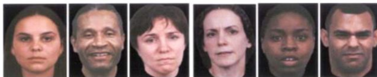
Нейтральные эмоции (нет эмоций) и эмоции с низкой экспрессивной интенсивностью