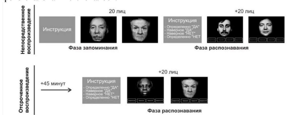
Рис. 3. Алгоритм проведения Пенсильванского теста запоминания лиц

– Первый этап «непосредственное воспроизведение» (CPF-I): фаза запоминания. Инструкция пациентам: «Вам будут показаны лица людей. Внимательно смотрите на них и постарайтесь запомнить». Пациенту на экране монитора предъявлялось 20 черно-белых эмоционально нейтральных лиц, которые нужно запомнить (рис.4). Каждый фото-эталон экспонировался 5 сек. Возвращение к предыдущим фото-эталонам исключалось.