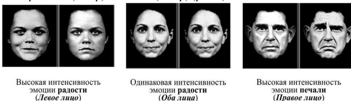
Рис. 6. Паттерны интенсивности экспрессий в Пенсильванском тесте дифференциации эмоций

Среди которых пары лиц с большей интенсивностью эмоции радости (16 пар) и печали (16 пар), пары с одинаковой интенсивностью эмоций радости (4 пар) и печали (4 пар) (рис.7).