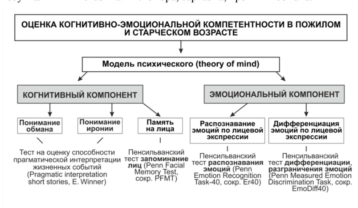
Рис. 2 Оценка когнитивно-эмоциональной компетентности в позднем возрасте

Мы рекомендуем проводить детальную оценку специфики социального познания гериатрического на основе предложенного нами алгоритма (рис.2) [3]. В нем мы делаем акцент на такой компонент социального познания как модель психического (theory of mind). Это метакогнитивная способность, обеспечивающая понимание психических состояний: эмоций намерений, ложных убеждений, чувств, мыслей своих и других людей. Данная способность позволяет пожилому человеку построить когнитивную модель психического состояния, отношений и предсказывать возможное поведение. Лежит в основе и понимания небуквальных высказываний: юмора, сарказма, иронии и обмана.