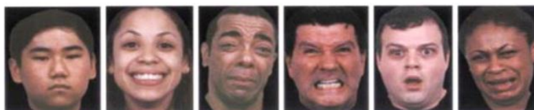
Нейтральные эмоции (нет эмоций) и эмоции с высокой экспрессивной интенсивностью